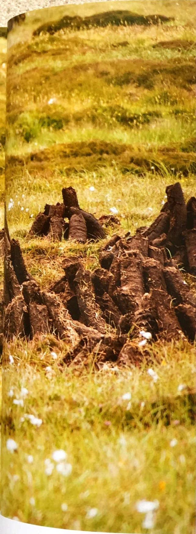
למעלה: כבול בלואיס (Alexandra K. Stevenson) מימין: כורי כבול באי לואיס (Lews Castle UHI)